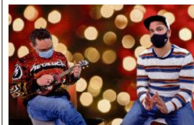
Das 20-Minuten-Duo singt vor.

ZÜRICH. Mach mit beim grössten Weihnachtskonzert der Schweiz! Spielst du ein Instrument oder singst du gern? Dann nimm ein Video von dir auf, wie du «Stille Nacht» in C-Dur spielst oder singst, und schick uns die Aufnahme. Aus allen Einsendungen produzieren wir das grösste Schweizer Weihnachtskonzert und zeigen es an Heiligabend auf 20minuten.ch. Alle Infos zu diesem Weihnachts-Event findest du online. 20M