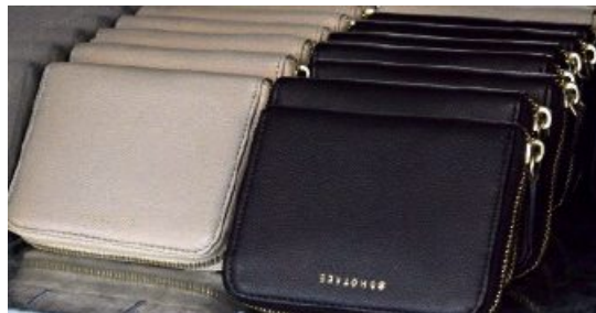
Die Produkte aus Apfelleder finden Anklang.